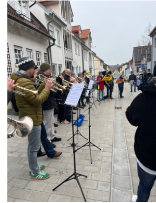
Unser Posaunenchor: auf der Empore; beim Oster- frühstück; Abschiedsständ- chen Bäckerei Stumpf

Konfi-Ausflug nach Speyer