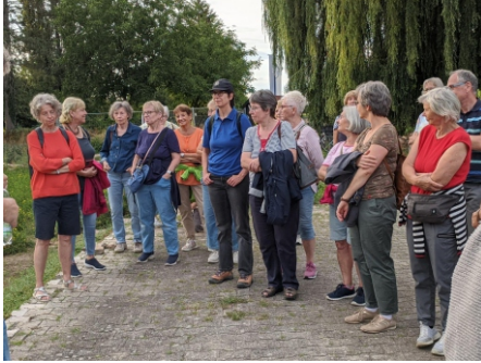
Frauengruppe MITTENDRIN