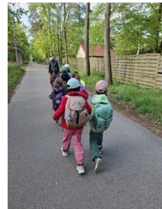
Unser Kindergarten: schlechtes Wet- ter gibt's nicht; sprechender Speiseplan; Schulanfänger bei der Feuer- wehr; auf dem Weg zum Tierpark